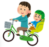
心肺蘇生の実技中