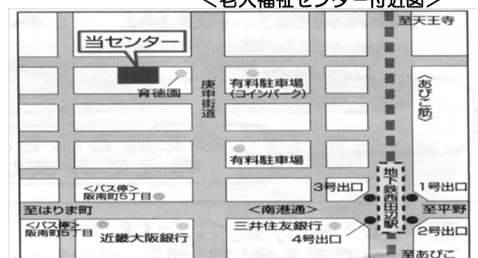
＜老人福祉センター付近図＞