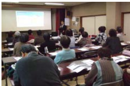
2/14 正しい薬の飲み方