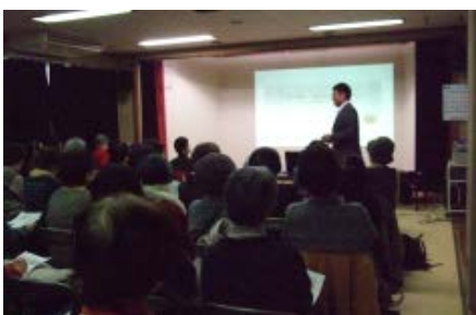
3/1 遺品整理の現場から