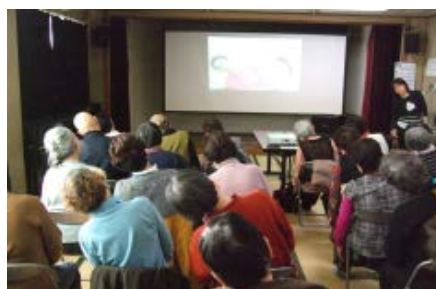
3/2 かみかみ体操体験会