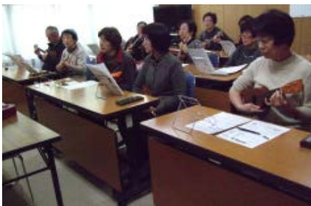
2/8・22・3/8 ウクレレ講習会