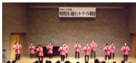
↑ ゆったりエアロ ↓ 歌体