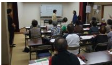
10/10 認知症について学ぼう