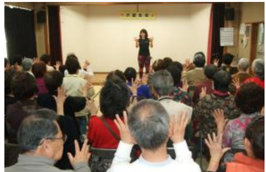
3/27 お誕生会 かんたん体操