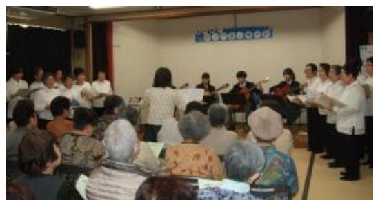
3/29 ふれあいギターコンサート