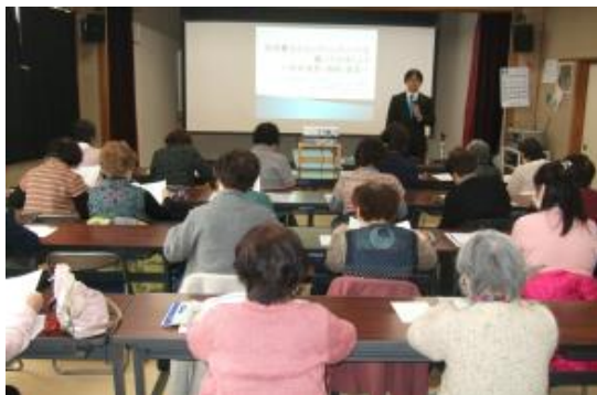
3/13 司法書士とエンディングノート を書いてみましょう