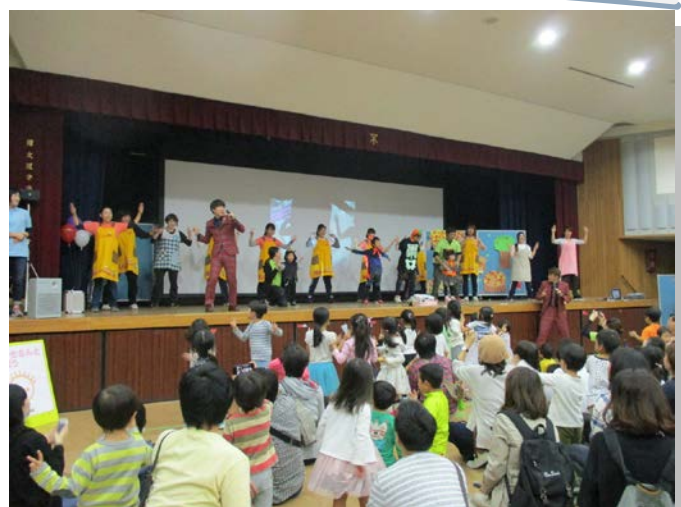
あべのつながりフェスタ フィナーレ (阿倍野区役所)

10月28日(土)に阿倍野区役所を中心に阿倍野区内の福祉施設などで「あべのつながりフェスタ」が開催されました。当日は朝から雨模様でしたが、多くの方に来場していただきました。阿倍野区役所の1階ではボランティアによる喫茶のコーナーや、ボランティアグループによる体操・体験コーナーまた被災地等の物産展や景品交換コーナーなどでもボランティアの方にご協力いただきました。