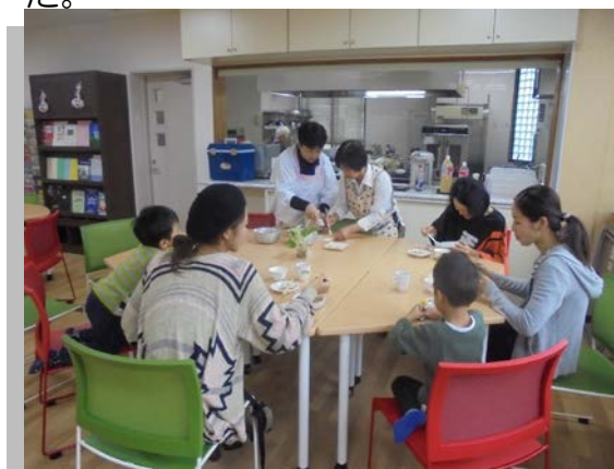
防災食の試食会 (阿倍野区社会福祉協議会にて)