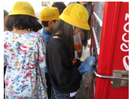
車いす、高齢者擬似体験装具を使いまちたんけんを実施