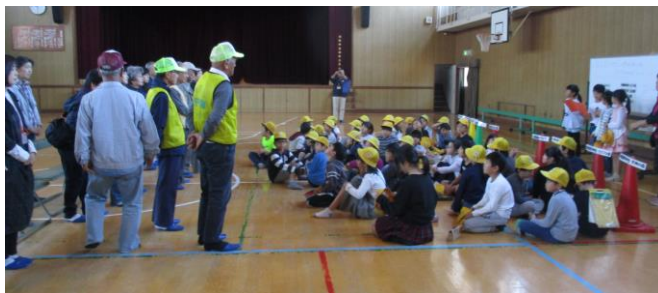
安全に実施できるよう、たくさんの方々にボランティア協力を頂きました