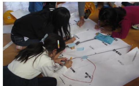
終了後、気づいたことを記入