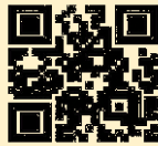
【 codomoto 】