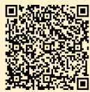
【 アンドロイド 】