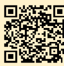
【 カレンダー 】