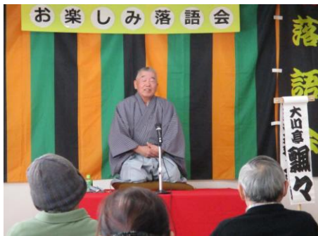
天満天神の会の素人寄席 今回の演目は「平林」「所帯念仏・ 蝦蟇(がま)の油」「宿替え」でした